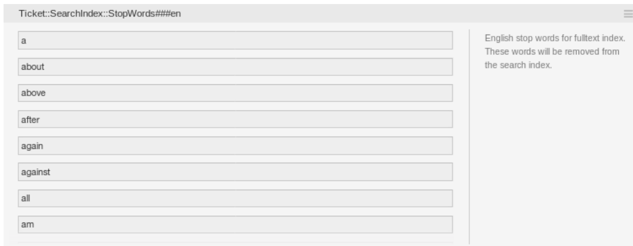
3. ábra: A Ticket::SearchIndex::StopWords###en beállítás

Ticket::SearchIndex::StopWords Angol kiszűrendő szavak a szabad-szavas indexnél. Ezek a szavak el lesznek távolítva a keresési indexből.